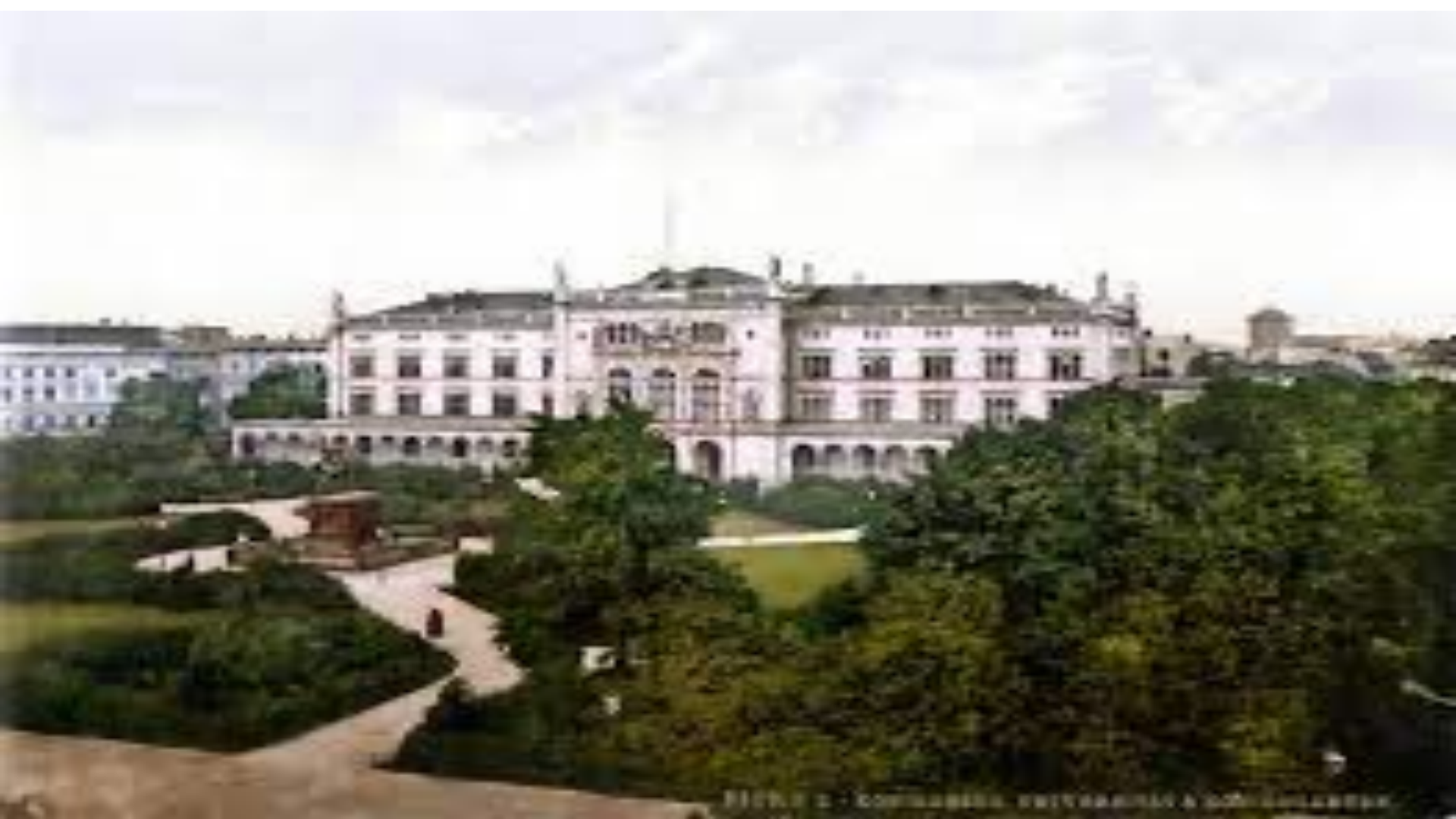
Рисунок 2 - Комплекс «Университет и сад» в Венеции